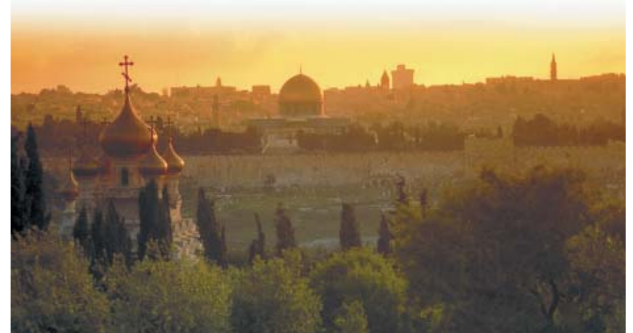
Vista de Jerusalén

«Como he participado en todo paso de avance hasta nuestra condición presente, al repasar la historia pasada puedo decir: "¡Alabado sea Dios!" Al ver lo que el Señor ha hecho, me lleno de admiración y de confianza en Cristo como director. No tenemos nada que temer del futuro, a menos que olvidemos la manera en que el Señor nos ha conducido, y lo que nos ha enseñado en nuestra historia pasada» (Notas biográficas de E. G. de White, pág. 216).