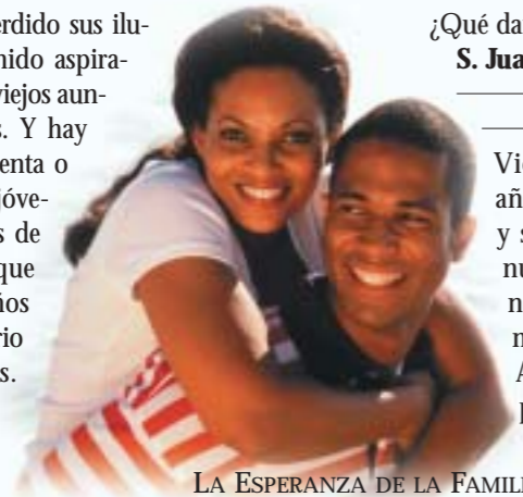
LA ESPERANZA DE LA FAMILIA

Hay jóvenes que han perdido sus ilusiones, o nunca han tenido aspiraciones de progreso. Son viejos aunque tengan veinte años. Y hay quienes, con sesenta, setenta o más años, todavía son jóvenes porque tienen ganas de vivir. A una ancianita que cumplía los noventa años su nieto le regaló un diario para hacer anotaciones. Ella dijo: