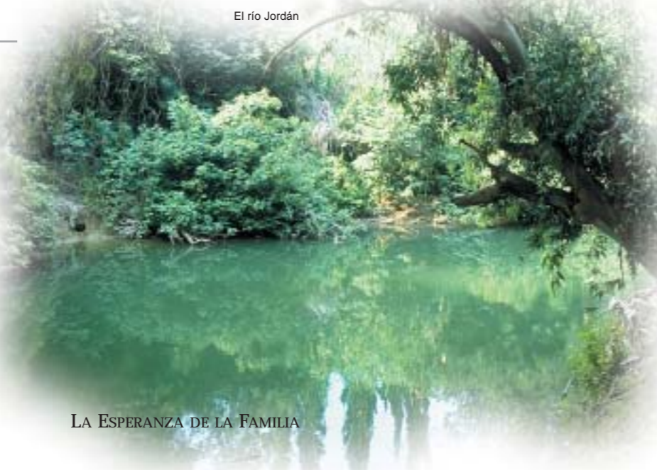
El río Jordán

Guiado por José, Jesús aprendió el oficio de carpintero. Él iba cantando a su trabajo, y sonriendo a aquellos con quienes se cruzaba, hasta el día en que le llegaron noticias de que Juan estaba bautizando. Jesús sabía que su hora había llegado. Limpió la carpintería por última vez, guardó sus herramientas que ya no usaría más, y despidiéndose de su madre, marchó hacia el río Jordán.